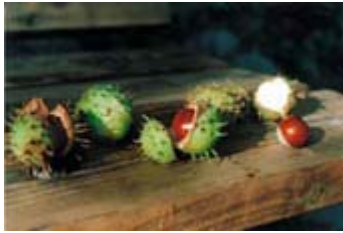
Fig 1. Hästkastanj.